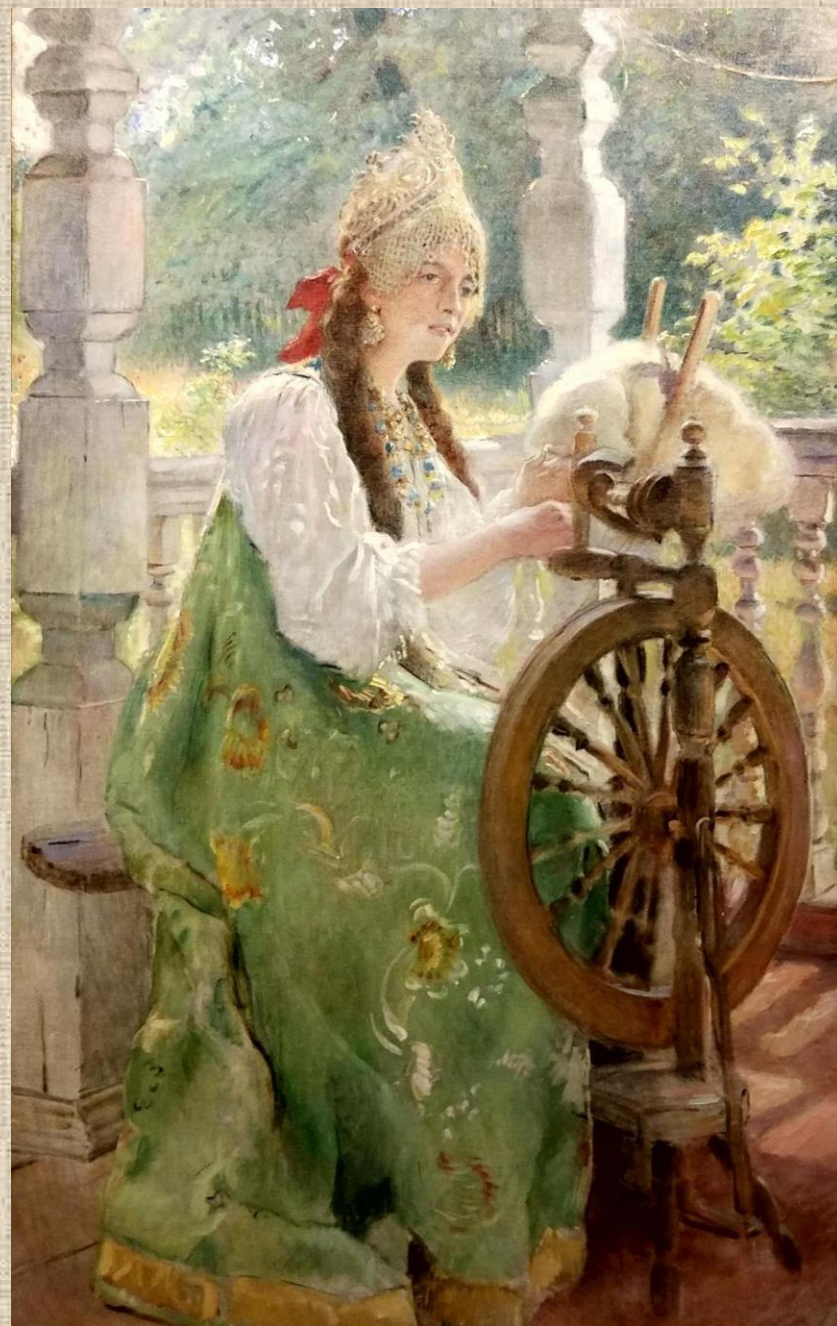
К.Е.Маковский За прялкой

Пряха - женщина, занимающаяся ручным прядением.