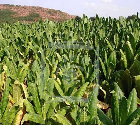
No:479496/03 Date:02.09.2003 История России. Табак в России. 3.76 x 3.24 cm, color, 4800 dpi