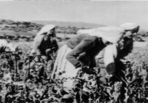
... government declares war on