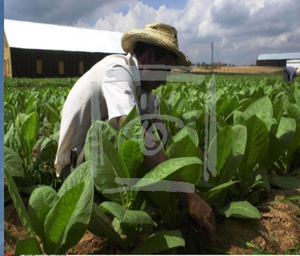
S010-2803 Куба, ноябрь 2008. На фото - сбор табака в районе Пинар-дель-Рио (Pinar Del Rio)